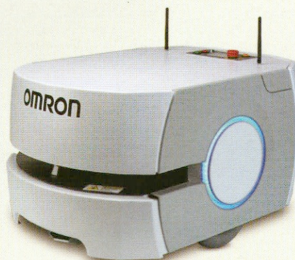
商用利用許諾を受けて掲載しております